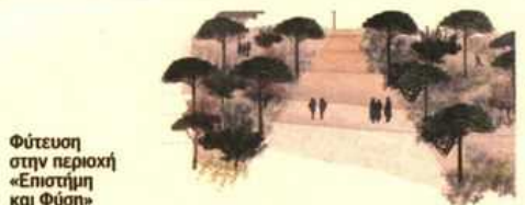
Φύτευση στην περιοχή «Επιστήμη και Φύση»