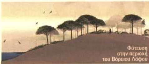
Φύτευση στην περιοχή του Βόρειου Λόφου