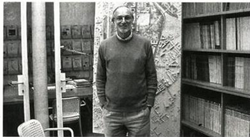
Η κοσμοθεωρία και η δουλειά του Ρέντζο Πιάνο, (εδώ ποζάρει στην «Κ» στο γραφείο του στο Παρίσι) βασίζεται στο «καλός καγαθός».

ται. Είναι διαφορετικό. Το περιορίζεται πχει αρνητικά. Η πραγματικότητα είναι ευκαιρία. Αν θέλεις, για παράδειγμα, να χτίσεις κάτι μνημειακό και δεις το ενεργειακό πρόβλημα σαν εμπόδιο, θα αποτύχεις. Πρέπει να δεις την ενέργεια ως πηγή εμπνεύσης. Στο Κέντρο Πολιτισμού Σταύρος Νιάρχος αυτό ακριβώς κάνουμε. Μετατρέπουμε το κτίριο σε ένα μεγάλο πάρκο. Τοποθετούμε το κτίριο κάτω από το πάρκο ώστε να μην καταναλώνει ενέργεια και εγκαθιστούμε στην πράσινη οροφή ένα μεγάλο ηλιακό θερμοσυσσωρευτή. Η οροφή είναι κάτι ζωντανό και όχι αποκομμένο. «Τραγουδάει» την ανάγκη για ενέργεια, δεν τη φέρει βαρέως, δεν υποφέρει από αυτήν την ανάγκη. Την περασμένη χρονιά τέλειωσα ένα έργο στο Σαν Φρανσίσκο, την Ακαδημία Επιστημών της Καλιφόρνιας. Αυτό το κτίριο δεν έχει αир κοντίσιον. Νομίζω είναι το πρώτο τόσο μεγάλο κτίριο στις ΗΠΑ που δεν έχει αир κοντίσιον. Δημιουργήσαμε μια κυματιστή οροφή με φυτά, τοπικά είδη φυτών. Η ποιότητα ενώθηκε με την πραγματικότητα. Η ανάγκη ήταν να καταναλώνουμε λιγότερη ενέργεια. Αλλά η ανάγκη δημιούργησε μια ευκαιρία,