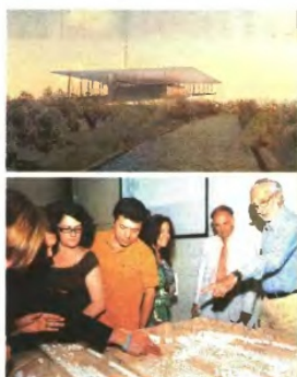
Ο αρχιτέκτονας Ρέντζο Πιάνο παρουσιάζει τα τελικά σχέδια για το ΚΠΙΣΝ

Το νερό είναι ένα από τα βασικά υλικά του Κέντρου. Ένα υδάνιο κανάλι 400 μ. μήκους, παράλληλα στη Συγγρού, θα επαναφέρει όπως άλλοτε το νερό στην Καλλιθέα, για τους κατοίκους της οποιίας θα γίνουν αθλητικές εγκαταστάσεις, ενταγμένες στη συνολική αισθητική του έργου. Τα υπόλοιπα υλικά: Τοιμήνιο για τους τοίχους, γιατί προσφέρει «σαφνεία και