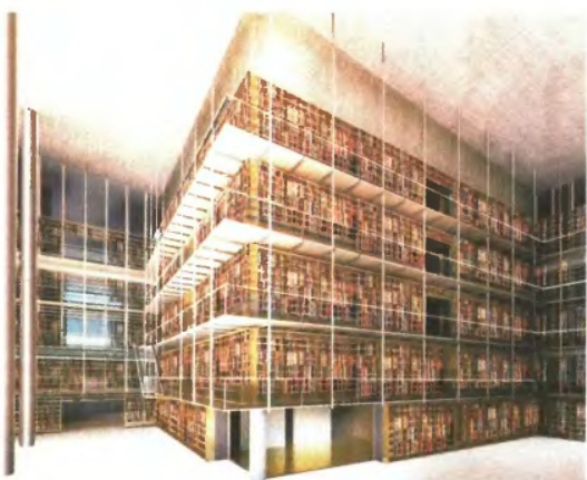
Ο εντυπωσιακός πύργος από βιβλία, ύψους τριών ορόφων, θα υποδέχεται τους επισκέπτες στη νέα Εθνική Βιβλιοθήκη

δα, για να τις προσήφεις της Λιρικής και της Βιβλιοθήκης, με ενσωματωμένο σίδερο. Όταν πέφτει ο ήλιος πάνω του, θα