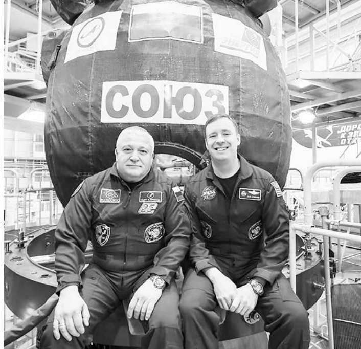
Ο Φιοντόρ Γιουρτσίν (Ρωσία) και Τζακ Φίσερ (ΗΠΑ), πριν την εκτόξευση, σε φωτογραφία που παραχώρησε η NASA.

Ο βετεράνος κοσμοναύτης, θα παραμείνει για περίπου 4,5 μήνες στο Διεθνές Διαστημικό Σταθμό (ISS) και μαζί με τον Αμερικανό αστροναύτη Τζακ Φίσερ της NASA εκτοξεύθηκαν την Πέμπτη 10:13 το πρωί ώρα