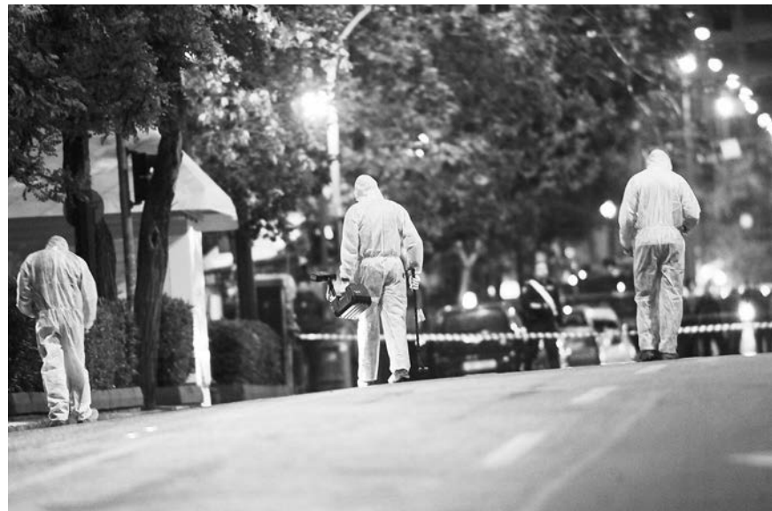
Ολη τη νύχτα άνδρες της Αντιτρομοκρατικής έψαχναν για στοιχεία. Δεξιά, Άνδρες του Δήμου Αθηναίων μόλις η Αντιτρομοκρατική τέλειωσε το έργο της καθάριζαν για ώρες τον χώρο μπροστά στην τράπεζα από τα μάζα που προκάλεσε η έκρηξη.

Ο Κυριάκος Μητσοτάκης στην επιστολή του αναφέρει: «Αγαππητέ Θεόδωρ,