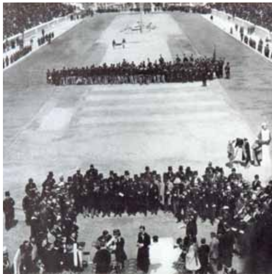
The awards ceremony, Athens Olympics, 1896.

Η τελετή απονομής των μεταλλίων, Ολυμπιακοί Αγώνες, Αθήνα, 1896.