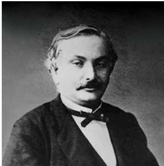
Michel Jules Alfred Bréal (1832 - 1915) Ο Μιχαήλ Ιούλιος Αλφρέδος Μπρεάλ (1832 - 1915)

The race that Bréal envisioned was based on the legend that in