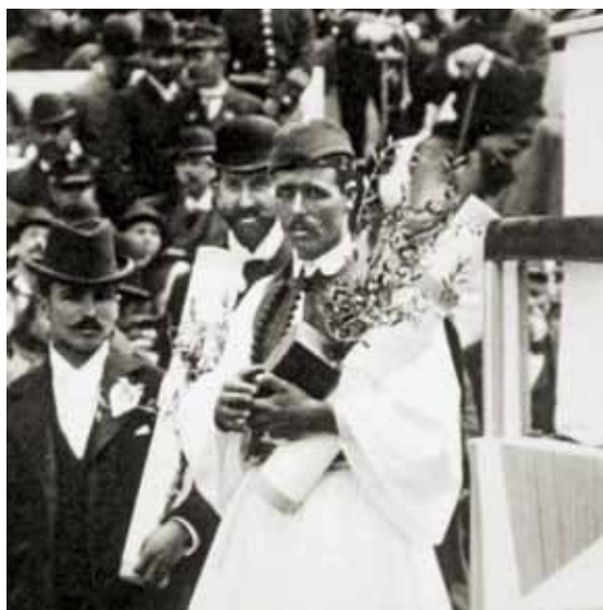
Louis holding the Bréal Cup in its presentation box and an olive branch at the awards ceremony of the 1896 Olympics. Ο Λούης κρατώντας το κύπελλο Μπρεάλ, μέσα στο κουτί του, και ένα κλαδί ελιάς στην τελετή απονομής των Ολυμπιακών του 1896.

τους θυμίζει ότι η Ελλάδα προσδοκούσε μία νίκη. Ένας από τους Έλληνες, ο Σπύρος Λούης, παρ' ότι επελέγη αργά για συμμετοχή στον αγώνα, βρέθηκε στην όγδοη θέση στο εικοστό δεύτερο χιλιόμετρο, μόλις μετά τα μέσα της διαδρομής. Καθώς οι προπορευόμενοι δρομείς άρχισαν να χάνουν τις δυνάμεις τους προς το τέλος του αγώνα, ο Λούης τους προσπέρασε έναν-έναν και τελικά κατέκτησε την πρώτη θέση, συνοδευόμενος από τις ζητωκραυγές του πλήθους που είχε κατακλύσει τους δρόμους της Αθήνας. Στο Στάδιο, η νίκη του επιβεβαιώθηκε όταν ο ταγματάρχης του στρατού, ο οποίος ήταν ο υπεύθυνος