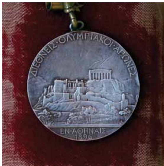
The reverse side of the medal Louis won in 1896 that depicts the Acropolis. Η πίσω πλευρά του μεταλλίου που ο Λούης κέρδισε το 1896, η οποία απεικονίζει την Ακρόπολη.

αμέσως τη σημασία της στιγμής. Ήταν εκείνο το είδος του ενθουσιασμού που μπορούν να δημιουργήσουν οι αθλητικοί αγώνες και ο Λούης, ένας «μεγαλοπρεπής χωρικός», δεν ήταν εξοικειωμένος με προπονήσεις και επιστημονικές μεθόδους, ανταποκρινόμενος έτσι στην αντίληψη του Κουμπερτέν περί αθλητικής αγνότητας. Όπως ανέφερε στα απομνημονεύματά του: «Η νίκη του ήταν μεγαλοπρεπής σε λαμπρότητα και απλότητα. Έφτασε στην είσοδο του σταδίου, το οποίο ήταν γεμάτο με περισσότερους από εξήντα χιλιάδες θεατές, χωρίς κανένα σημάδι εξάντλησης και όταν ο Πρίγκιπας Κωνσταντίνος