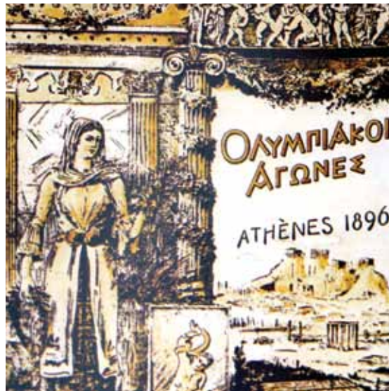
The cover of the official album of the Athens 1896 Olympics. Το εξώφυλλο του επίσημου λευκώματος των Ολυμπιακών Αγώνων της Αθήνας το 1896.

ως βραβείου για το νικητή, διότι συμβάδιζε με το όνειρο της αναβίωσης των Ολυμπιακών. Ο Μαραθώνιος Δρόμος ήταν μία πρωτότυπη ιδέα, ένα νέο άθλημα, το οποίο δεν υπήρχε ανάμεσα στους αγώνες που διοργανώνονταν στην Αρχαία Ολυμπία ή τους άλλους ιερούς χώρους όπου πραγματοποιούνταν αθλητικές εκδηλώσεις στην Αρχαία Ελλάδα. Ο μεγαλύτερος μήκος αγώνας δρόμου στην Ολυμπία ήταν ο «δόλιχος», (η απόσταση ήταν 24 «στάδια», τα οποία αντιστοιχούν σε 4,6 χιλιόμετρα ή 3 μίλια. Υπάρχουν, ωστόσο, άφθονα στοιχεία ότι οι Αρχαίοι Έλληνες έτρεχαν αποστάσεις πολύ