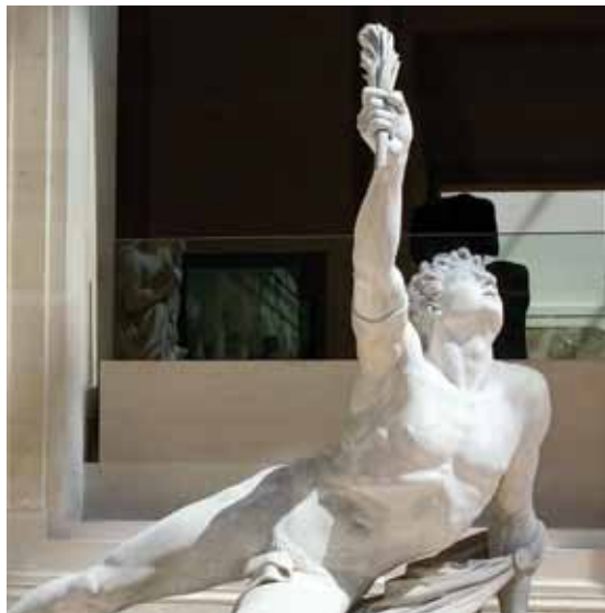
The Soldier of Marathon sculpture by Jean-Pierre Cortot (French, 1787-1843), Louvre Museum. "Ο Στρατιώτης του Μαραθώνα" γλυπτό του Jean-Pierre Cortot (Γάλλος, 1787-1843), Μουσείο του Λούβρου.

battle of Marathon in historical but also symbolic terms grew steadily. To the extent that one can identify consensus among historians of Classical Greece there is agreement that the Greek victory at Marathon did not mean Athens won the war, but rather that it was one of several events and battles that eventually eliminated the Persian threat. Yet it is undeniable that it represented an enormous psychological gain for the Athenians. Herodotus viewed the battle as the beginning not the end of the wars against the Persians, and Themistocles regarded the battle as a prelude and part of a greater struggle. But soon history gave way to legendary associations. The playwright Aeschylus who fought there and who lost his brother in the battle depicted it as a victory of free men, living in a democracy, over a monarchy that ruled over vassals. Gradually the battle grew in significance. Pausanias asserts that the local people of Attica worshipped its battle heroes as divine. The value attached to Classical Greece in the minds of 18th and 19th century literary figures in Europe contributed to the amplification of the battle's symbolism. Samuel Johnson, the prominent 18th century English author and essayist, saw it as an important reflection of patriotism. Lord Byron considered it a magic word associated with the idea of freedom, and John Stuart Mill believed it to be more important to British history than the battle of Hastings, which ushered in the Norman conquest of England in 1066. 2