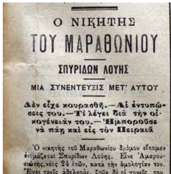
The ASTY newspaper's report on the marathon race and an interview with Louis published the day after the marathon race. Η αναφορά της εφημερίδας ΑΣΤΥ στον μαραθώνιο και συνέντευξη με τον Σπύρο Λούη, που δημοσιεύτηκε την ημέρα μετά τον μαραθώνιο.

νικητής του Μαραθωνίου. Όπως εξηγεί μία από τις πρώτες ιστορίες του ελληνικού στίβου, «Η γενική και ομόθυμος επιθυμία του κόσμου ήτο να εκερδίζαμε τουλάχιστον τον Μαραθώνιον, τον οποίον από της πρώτης στιγμής ο λαός μας εθεώρησεν ως κατ'εξοχήν εθνικόν αγώνισμα». 10 Το ενδιαφέρον για τον Μαραθώνιο ήταν τόσο μεγάλο που κάποιοι αποφάσισαν να τρέξουν από τον Μαραθώνα, αναφέροντας την ώρα αναχώρησής τους κατά την άφιξή τους στο στάδιο, αν και σε πολλές περιπτώσεις δεν υπήρχαν μάρτυρες. 11