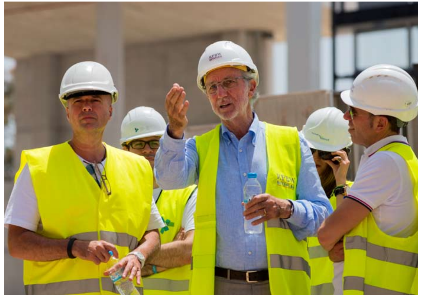
Ο ΑΝΔΡΕΑΣ ΔΡΑΚΟΠΟΥΛΟΣ (αριστερά) μαζί με τον ιταλό αρχιτέκτονα Ρέντσο Πιάνο (κέντρο) κατά τη διάρκεια κοινής τους επίσκεψης στο εργοτάξιο του ΚΠΙΣΝ τον Αυγουστο του 2014.

«Η ελπίδα και η πίστη μας είναι ότι το Δημόσιο και -το σημαντικότερο- η κοινωνία στο σύνολό της θα σταθούν στο ύψος των περιστάσεων».