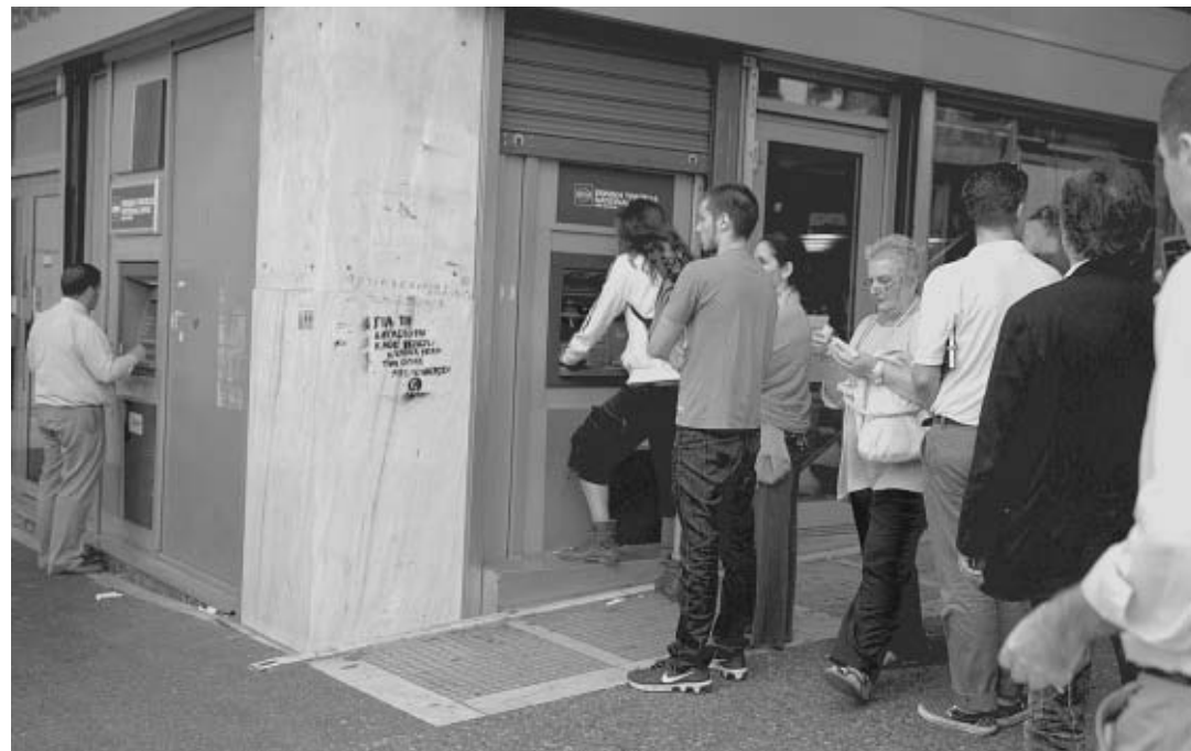
Αθηναίοι στην ουρά μπροστά από ένα ATM της Εθνικής Τράπεζας, χθες Παρασκευή.

Ωστόσο, παρά την αρνητική ειδησιογραφία και την αυξημένη πίεση, για μία ακόμη φορά