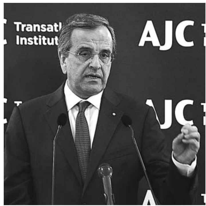
Ο πρωθυπουργός Αντώνης Σαμαράς κατά την χθεσινή του ομιλία.

Τέλος, ο Πρωθυπουργός υπογράμμισε ότι πρέπει όλοι να επιδείξουμε μηδενική ανοχή στο ρατσισμό, στην τρομοκρατία και στην παραβίαση της έννομης τάξης. «Εχουμε υποχρέωση να σταματήσουμε το ρατσισμό πριν ξεκινήσει. Και οποιοδήποτε πριν καθεί κάθε έλεγχος. Ολα τα είδη ρατσισμού είναι απαράδεκτα. Ο αντισημιτισμός είναι εντελώς απαράδεκτος», ανέφερε ο κ. Σαμαράς, σημειώνοντας ότι σήμερα στην Ελλάδα εννοείται η σχετική νομοθεσία εναντίον του ρατσισμού, με σαφείς αναφορές στις γεννογονίες και το Ολοκαύτωμα. «Τέτοιες πικρές αναμνήσεις πρέπει να χαραχθούν βαθιά στη συνείδησή μας και οι κοινωνίες να μην ξεχάσουν ποτέ. Δεν είναι απλώς υποχρέωσή μας απέναντι σε εκείνους που χάθηκαν τότε. Είναι επίσης, υποχρέωσή μας απέναντι στη σημερινή και τις μελλοντικές γενιές, να θυμόμαστε και να μην επανέλθουμε ποτέ την επανάληψη παρόμοιων φρικαλεοτήτων», κατέληξε.