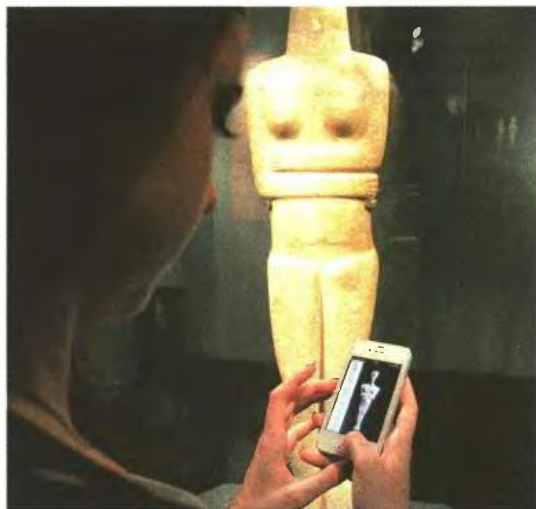
Το Μουσείο Κυκλαδικής Τέχνης είναι το πρώτο ελληνικό που απέκτησε εφαρμογή για κινητά και ταμπλέτες