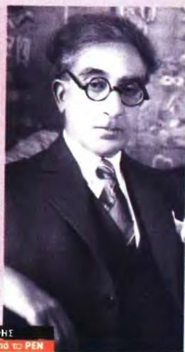
Κ. Π. ΚΑΒΑΦΗΣ Αφιέρωμα από το PEN