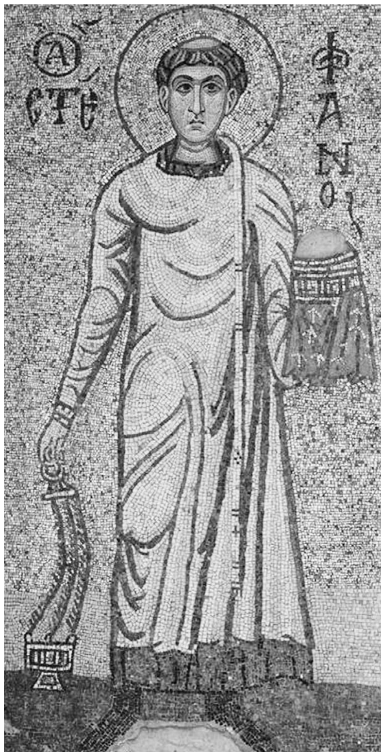
Εικόνα σε μωσαϊκό που απεικονίζει τον Άγιο Στέφανο.

Ορειχάλκινη θύρα, μεγάλων διαστάσεων (3,3 x 1,8μ.), που κατασκευάστηκε σε εργαστήριο της Κωνσταντινούπολης στις αρχές του 11ου αιώνα. Η θύρα είναι εν χρήσει στον Ναό του Σωτήρος στο Ατράνι της Ιταλίας, μια μικρή πόλη κοντά στο Αμάλφι. Η θύρα διακοσμείται με τέσσερις εικόνες, του Χριστού, της Παναγίας, του Αγίου Πανταλέοντος και του Αγίου Σεβαστιανού, καθώς και από φυλλοειδείς σταυρούς.