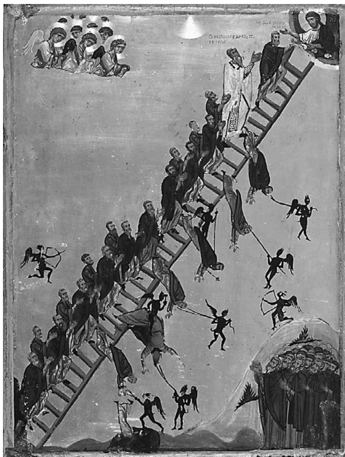
Αριστερά: Εικόνα με την Ουρανοδόμο Κλίμακα του αγίου Ιωάννη της Κλίμακος. Δεξιά: Το Θυματό του ναού. Αντικείμενο από ασήμι και χρυσό που αποδίδει σε μικρογραφία μια βυζαντινή εκκλησία και ανήκει στον Θησαυρό της Βασιλικής του Αγίου Μάρκου.

Και πώς να μην είναι όταν προχωρώντας στην οδό Πικαντίλι του Λονδίνου φτάνεις στο Μπάρλινγκτον Χάουζ, της RAA. Μπροστά