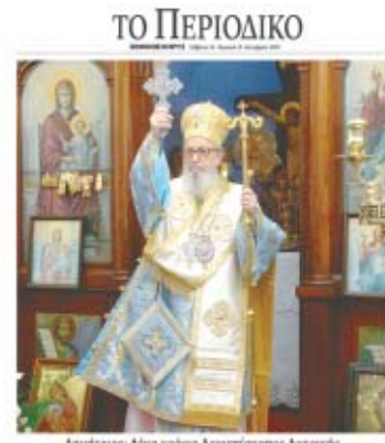
Δημήτριος, Άγιος Κήρυκας Αμερικής