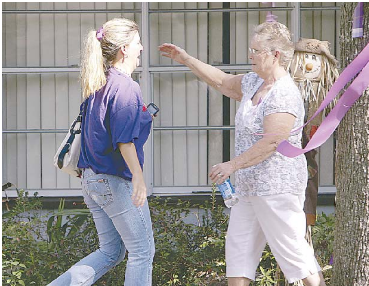
ΦΙΛΑ ΚΟΛΛΕ/ΑΣΟΣ/ΙΕΤΕΝΤ ΠΡΕΣ

Η μακροχρόνια πιστοληπτική ικανότητα των τεσσάρων τραπεζών βσιίζεται στην ατομική οικονομική τους ισχύ και δεν θίγεται από την υποβάθμιση της Ελλάδας, επισημαίνεται σχετικά από το διεθνή οίκο, ο οποίος ωστόσο, υποβάθμισε την ΑΤΕbank σε «BBB» από «BBB+», με τις προοπτικές να πα-