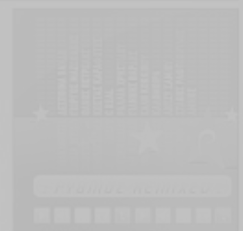
RITHMOS REMIXED Various Hits