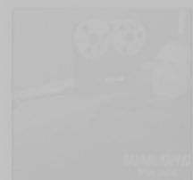
VASILIS KARRAS Cross Path