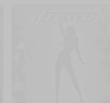
FRESCA 3 Various Hits