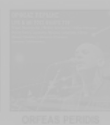
ORFEAS PERDIS Live Me Your Pleas