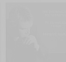
MANDOLIS LIDARIS Mi Mou Giveteis T' Ocho