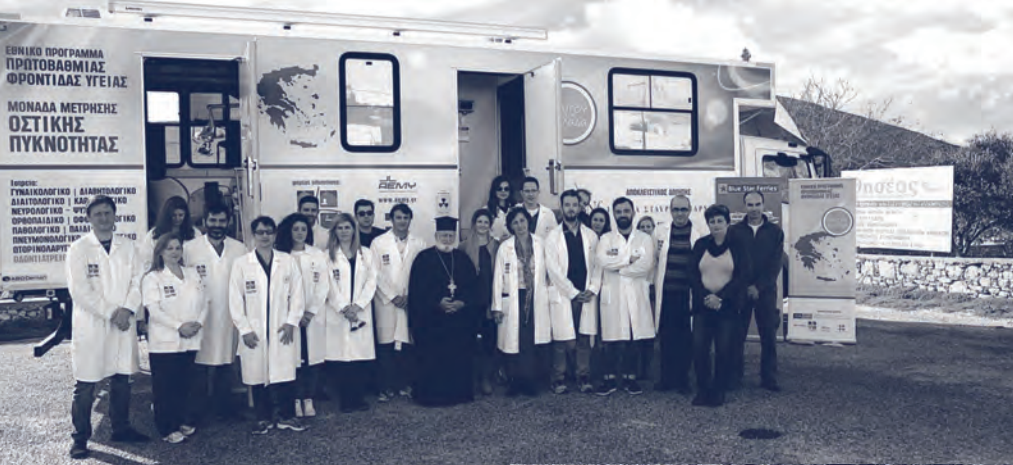
Φωτογραφίες από τα Αθλητικά μονοπάτια, τις Κινητές Ιατρικές Μονάδες και το Sports Excellence.