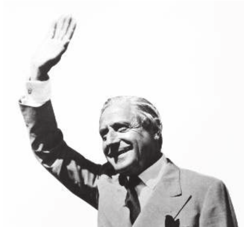
Σταύρος Νιάρχος (1909-1996). Ιδρυτής του Ιδρύματος Σταύρος Νιάρχος Stavros Niarchos, (1909 - 1996). Founder of the Stavros Niarchos Foundation

Το Ίδρυμα Σταύρος Νιάρχος (ΙΣΝ) είναι ένας διεθνής κοινωφελής και κατ' επέκταση φιλανθρωπικός οργανισμός, αποστολή του οποίου και μοναδικό του έργο είναι η πραγματοποίηση δωρεών σε μη κερδοσκοπικούς οργανισμούς (ΜΚΟ), σε ένα ευρύ πεδίο δράσης. Σημείο εκκίνησης της κοινωφελούς δράσης του ΙΣΝ είναι η προσφορά αρωγής προς την κοινωνία συνολικά, με ιδιαίτερη έμφαση στους συνανθρώπους μας που χρειάζονται περισσότερο τη βοήθειά μας. Το ΙΣΝ δεν ζητά ούτε δέχεται δωρεές από τρίτους, καθώς η δράση του στηρίζεται εξολοκλήρου στις δωρεές που πραγματοποιεί το Ίδρυμα από το κληροδότημα του ιδρυτή του, του αείμνηστου θείου μου, Σταύρου Νιάρχου. Η φροντίδα για τον