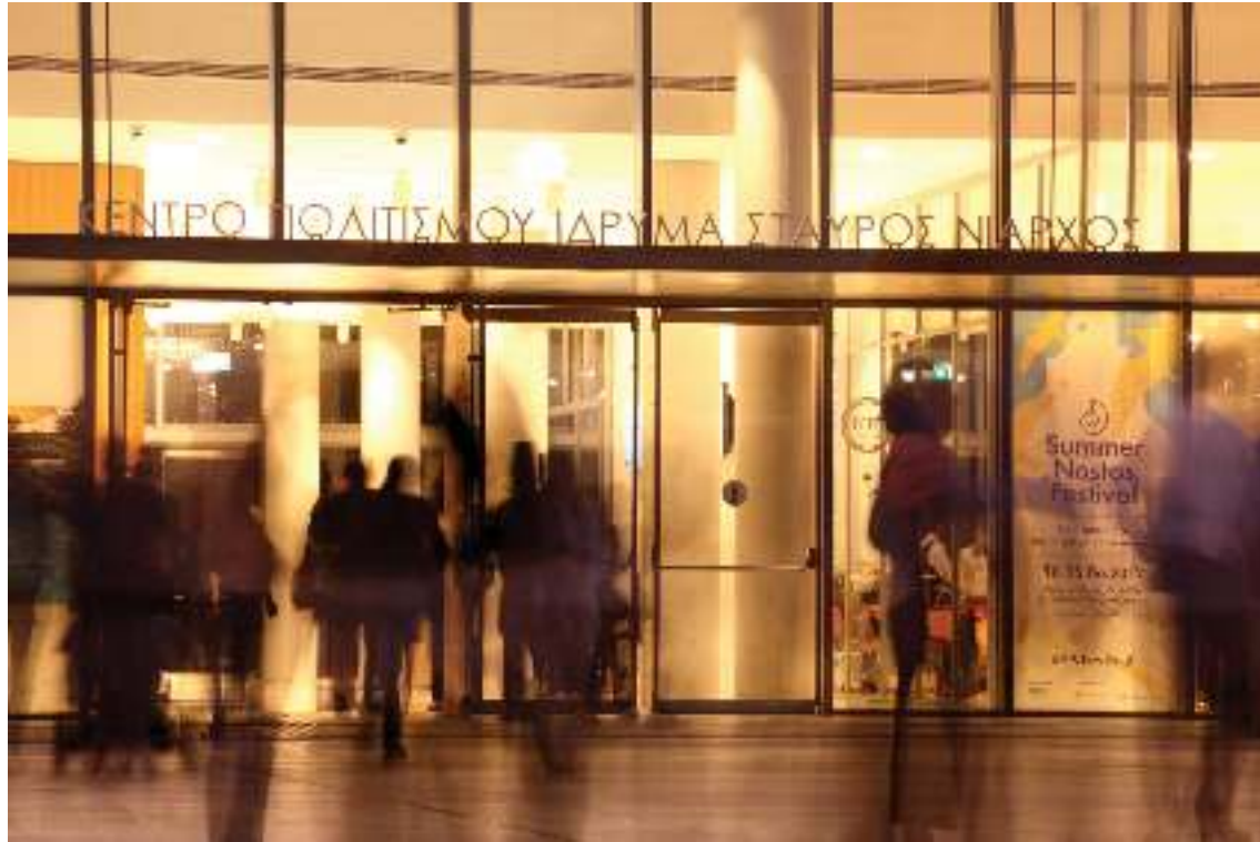
Κέντρο Πολιτισμού Ίδρυμα Σταύρος Νιάρχος Stavros Niarchos Foundation Cultural Center