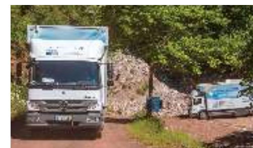
Κινητές Ιατρικές Μονάδες, Mobile Medical Units

Το Ίδρυμα Σταύρος Νιάρχος και το Ίδρυμα FC Barcelona συνεργάζονται για την κοινωνική ενσωμάτωση παιδιών προσφύγων. The Stavros Niarchos Foundation and the FC Barcelona Foundation are collaborating for the social inclusion and integration of refugee children