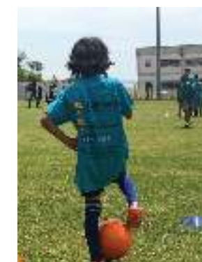
Κέντρο Πολιτισμού Ίδρυμα Σταύρος Νιάρχος Stavros Niarchos Foundation Cultural Center

Το Ίδρυμα Σταύρος Νιάρχος και το Ίδρυμα FC Barcelona συνεργάζονται για την κοινωνική ενσωμάτωση παιδιών προσφύγων. The Stavros Niarchos Foundation and the FC Barcelona Foundation are collaborating for the social inclusion and integration of refugee children