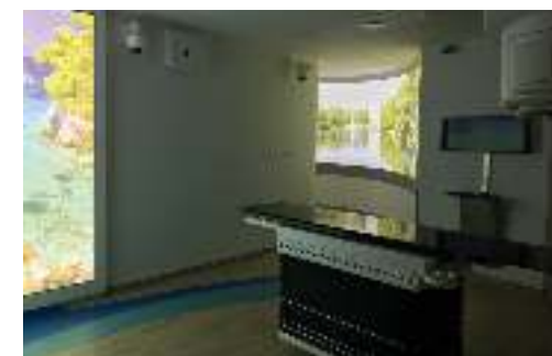
Πρόγραμμα Αντικατάστασης Μηχανημάτων Ακτινοθεραπείας Programme for the Replacement of Radiotherapy Equipment