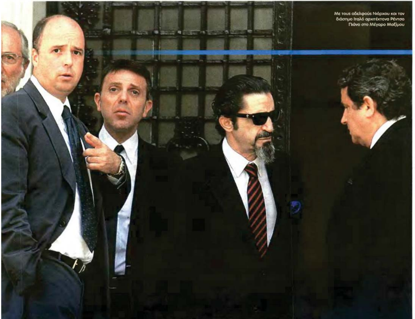
Με τους αδελφούς Νιάρκου και τον διάσημο Ιταλό αρχιτέκτονα Ρέντσο Πιάνο στο Μέγαρο Μαξίμου

Κυριακή 15 Ιανουαρίου 2012 | Πρώτο Θέμα ♦ 21