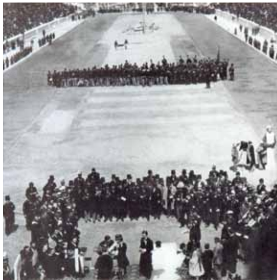
The awards ceremony, Athens Olympics, 1896. Η τελετή απονομής των μεταλλίων, Ολυμπιακοί Αγώνες, Αθήνα, 1896.