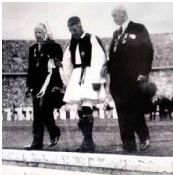
Louis in the Olympic Stadium, Berlin 1936 Ο Λούης στο Ολυμπιακό Στάδιο, Βερολίνο 1936.

πόλεμο ενάντια στην Οθωμανική Αυτοκρατορία το 1897 και συνέχισε να υποστηρίζει τις προσπάθειές του για την ενίσχυση των Ολυμπιακών Αγώνων, ενθαρρύνοντάς τον να διασφαλίσει την καθέρωση του Μαραθωνίου Δρόμου ανάμεσα στα αγωνίσματά τους. 17 Ο Μπρεάλ πέθανε σε ηλικία ογδόντα τριών ετών το 1915 και εξυμνήθηκε για την τεράστια συνεισφορά του στη σημασιολογία και τη γαλλική δημόσια παιδεία. Μία νεκρολογία που γράφτηκε από το διάσημο Γάλλο Αιγυπτιολόγο Gaston Maspero είχε έκταση τριάντα έντυπες σελίδες. 18 Ο Λούης δε συμμετείχε ξανά σε Μαραθώνιο και αποσύρθηκε αμέσως από το φως της δημοσιότητας, συνεχίζοντας τη ζωή του στο Μαρούσι. Από όλες τις προσφορές που έλαβε, διάλεξε μία νέα άμαξα για να μπορέσει να μεταφέρει νερό. Το 1936 ήταν καλεσμένος των διοργανωτών των Ολυμπιακών Αγώνων του Βερολίνου. Πέθανε το 1940, σε ηλικία εξήντα επτά ετών, έχοντας κερδίσει μια μόνιμη θέση στην ιστορία της σύγχρονης Ελλάδας και το σύγχρονο ελληνικό λεξιλόγιο, όπου καθιερώθηκε η έκφραση, για κάποιον που εξαφανίζεται γρήγορα, «Έγινε Λούης».