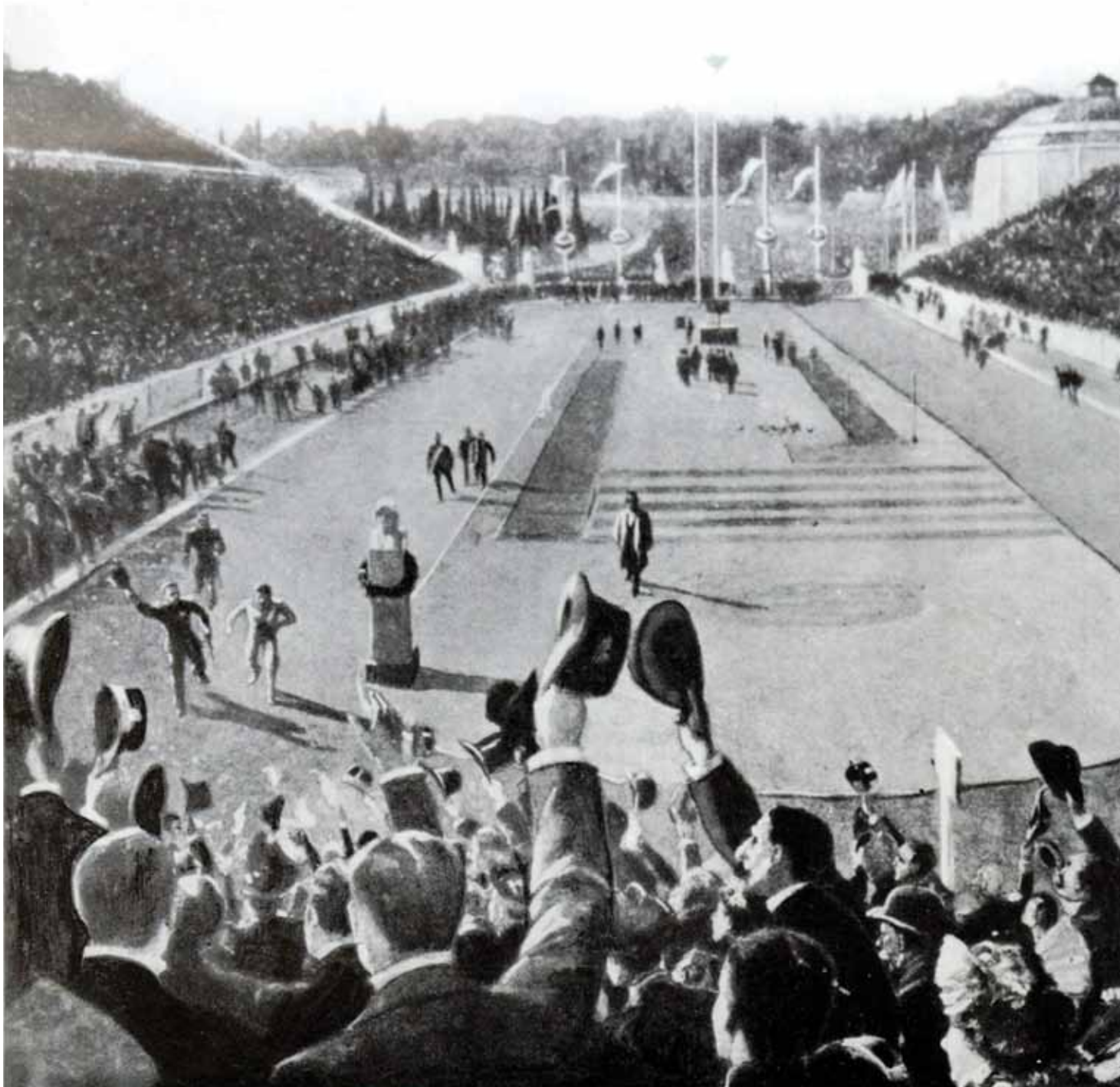
Spyros Louis at the finish line of the 1896 marathon - artist's rendering. Ο Σπύρος Λούης στη γραμμή τερματισμού του μαραθωνίου του 1896 - καλλιτεχνική απεικόνιση.