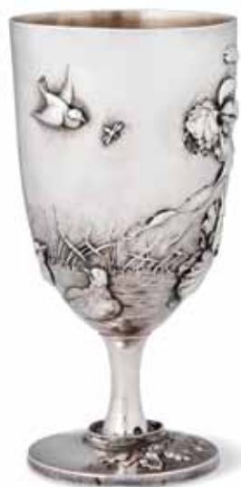
The reverse side of the Bréal Cup Η πίσω πλευρά του κυπέλλου Μπρεάλ

Αμέσως μετά την αποδοχή της ιδέας του Μαραθωνίου και του ειδικού βραβείου, το εν λόγω κύπελλο φιλοτεχνήθηκε από ασημί. Τα μετάλλια των νικητών των Ολυμπιακών Αγώνων του 1896 ήταν επίσης ασημένια. Τα χρυσά μετάλλια για τους νικητές υιοθετήθηκαν αργότερα. Συμβαδίζοντας με τη μετριοφροσύνη που χαρακτήριζε την Ολυμπιακή παράδοση, το μέγεθος του κυπέλλου ήταν σχετικά μικρό, με ύψος 15