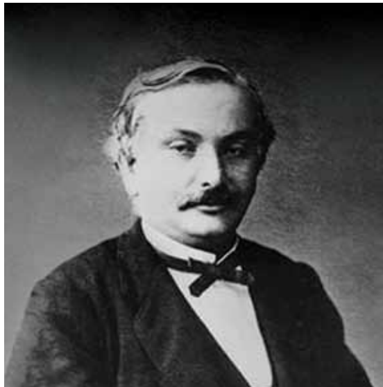
Michel Jules Alfred Bréal (1832 - 1915) Ο Μιχαήλ Ιούλιος Αλφρέδος Μπρεάλ (1832 - 1915)

The race that Bréal envisioned was based on the legend that in