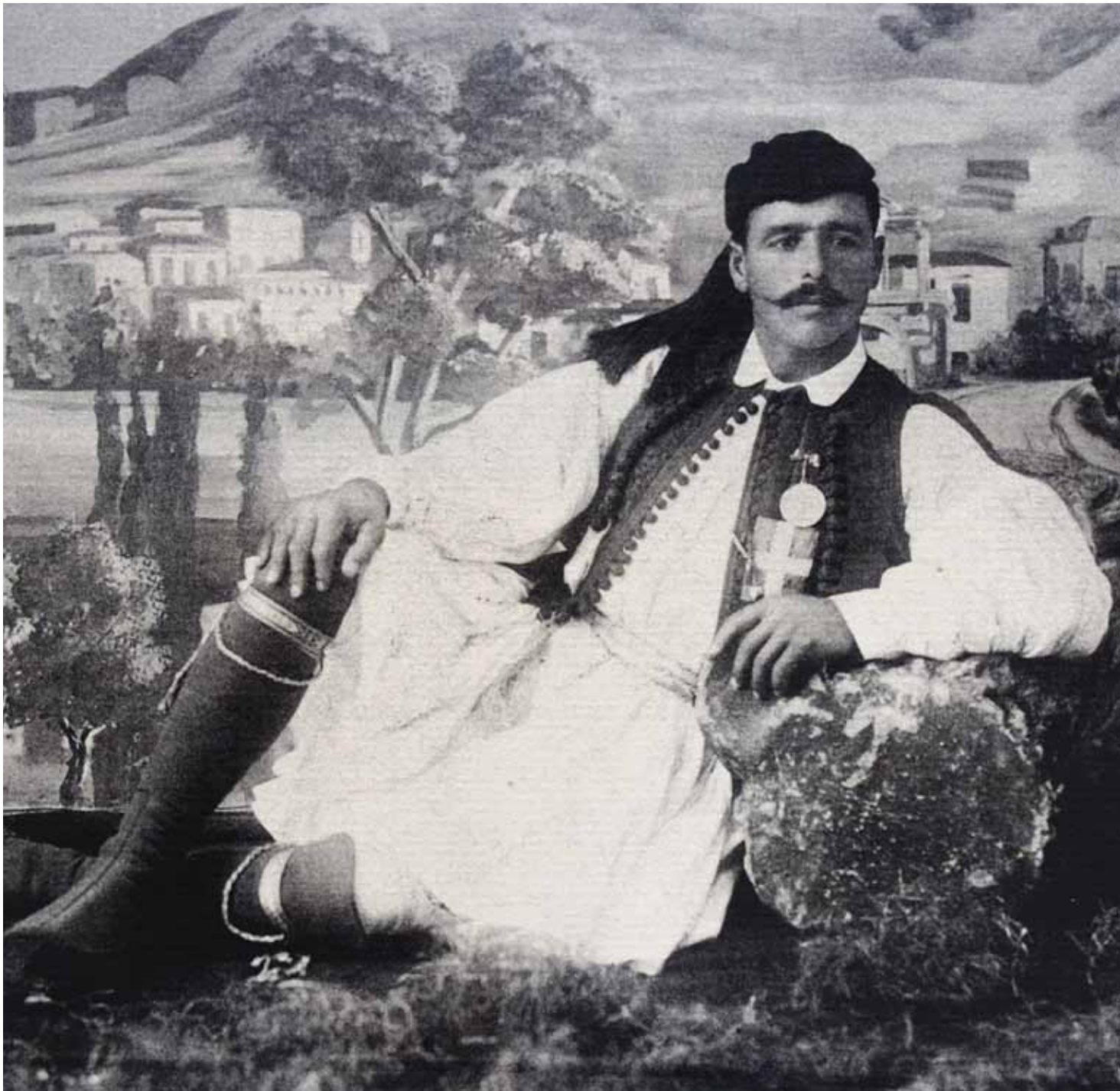
Louis's portrait in national costume, photo by Ioannes Lampakes. Πορτραίτο του Λουή με εθνική ενδυμασία, φωτογραφία του Ιωάννη Λαμπάκη.