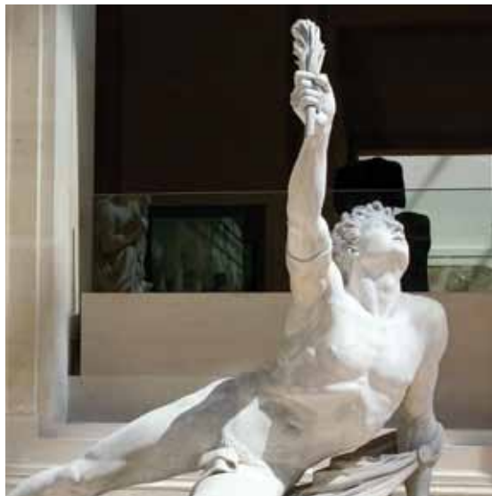
The Soldier of Marathon sculpture by Jean-Pierre Cortot (French, 1787-1843), Louvre Museum. "Ο Στρατιώτης του Μαραθώνα" γλυπτό του Jean-Pierre Cortot (Γάλλος, 1787-1843), Μουσείο του Λούβρου.

battle of Marathon in historical but also symbolic terms grew steadily. To the extent that one can identify consensus among historians of Classical Greece there is agreement that the Greek victory at Marathon did not mean Athens won the war, but rather that it was one of several events and battles that eventually eliminated the Persian threat. Yet it is undeniable that it represented an enormous psychological gain for the Athenians. Herodotus viewed the battle as the beginning not the end of the wars against the Persians, and Themistocles regarded the battle as a prelude and part of a greater struggle. But soon history gave way to legendary associations. The playwright Aeschylus who fought there and who lost his brother in the battle depicted it as a victory of free men, living in a democracy, over a monarchy that ruled over vassals. Gradually the battle grew in significance. Pausanias asserts that the local people of Attica worshipped its battle heroes as divine. The value attached to Classical Greece in the minds of 18th and 19th century literary figures in Europe contributed to the amplification of the battle's symbolism. Samuel Johnson, the prominent 18th century English author and essayist, saw it as an important reflection of patriotism. Lord Byron considered it a magic word associated with the idea of freedom, and John Stuart Mill believed it to be more important to British history than the battle of Hastings, which ushered in the Norman conquest of England in 1066. 2