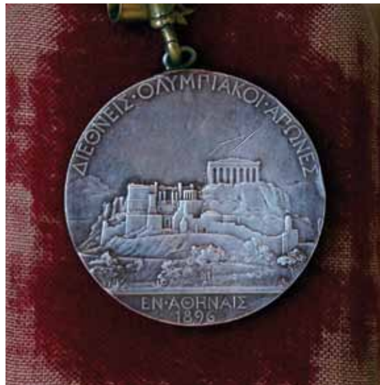
The reverse side of the medal Louis won in 1896 that depicts the Acropolis. Η πίσω πλευρά του μεταλλίου που ο Λούης κέρδισε το 1896, η οποία απεικονίζει την Ακρόπολη.

αμέσως τη σημασία της στιγμής. Ήταν εκείνο το είδος του ενθουσιασμού που μπορούν να δημιουργήσουν οι αθλητικοί αγώνες και ο Λούης, ένας «μεγαλοπρεπής χωρικός», δεν ήταν εξοικειωμένος με προπονήσεις και επιστημονικές μεθόδους, ανταποκρινόμενος έτσι στην αντίληψη του Κουμπερτέν περί αθλητικής αγνότητας. Όπως ανέφερε στα απομνημονεύματά του: «Η νίκη του ήταν μεγαλοπρεπής σε λαμπρότητα και απλότητα. Έφτασε στην είσοδο του σταδίου, το οποίο ήταν γεμάτο με περισσότερους από εξήντα χιλιάδες θεατές, χωρίς κανένα σημάδι εξάντλησης και όταν ο Πρίγκιπας Κωνσταντίνος