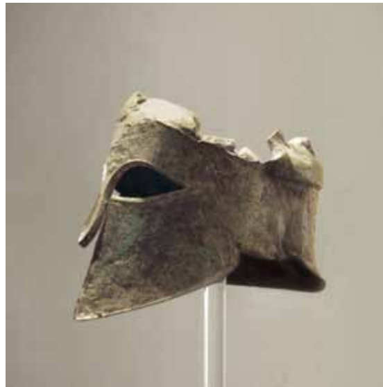
The Helmet of Miltiades (circa 490 BCE), Olympia Museum, Greece. The Athenian general in the battle of Marathon dedicated his helmet to Zeus as a sign of gratitude for the Greek victory over the Persians.

Ο αγώνας που οραματίστηκε ο Μπρεάλ βασιζόταν στον θρύλο, σύμφωνα με τον οποίο, το 490 π.Χ., ο Φειδιππίδης έτρεξε από τον Μαραθώνα στην Αθήνα – μια απόσταση περίπου 42 χιλιομέτρων ή 26 μιλίων – για να ανακοινώσει ότι οι Πέρσες είχαν ηττηθεί στη Μάχη του Μαραθώνα. Φθάνοντας στη