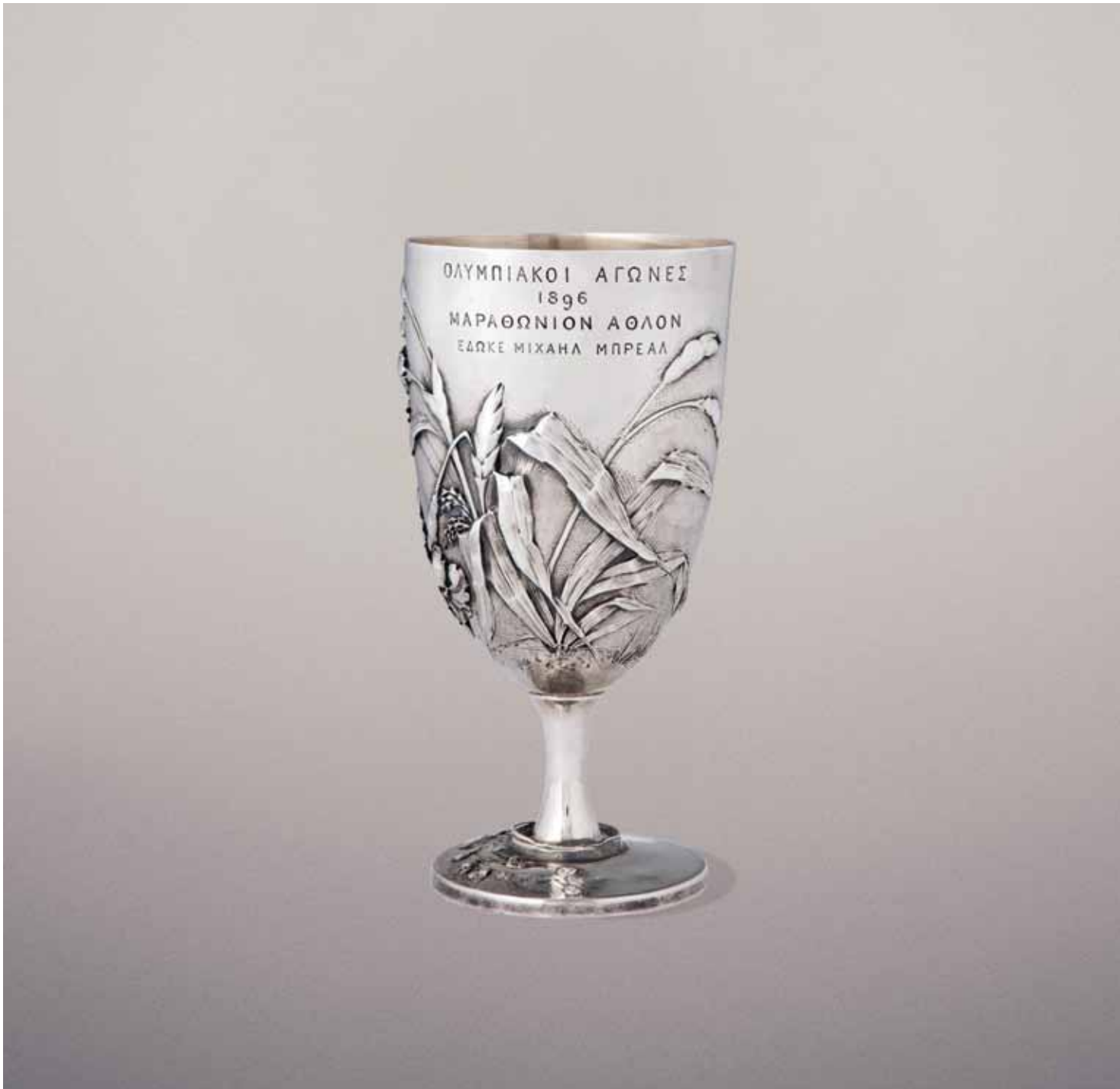
The Bréal Cup - The inscription reads: Olympic Games 1896, Marathon trophy donated by Michel Bréal. Το κύπελλο Μπρέαλ – Η επιγραφή αναφέρει: Ολυμπιακοί Αγώνες 1896, τρόπαιο Μαραθωνίου, δωρεά Μιχαήλ Μπρέαλ.