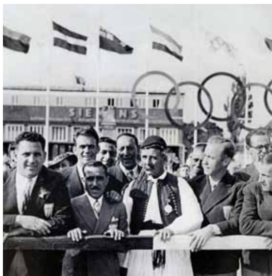
Louis during his visit to the Berlin Olympics in 1936. Ο Λούης κατά την επίσκεψή του στους Ολυμπιακούς του Βερολίνου το 1936.

στον οποίο αποτελούν ένα συλλογικό και έντονα βιωμένο θέαμα. Ο John MacAloon, καθηγητής του πανεπιστημίου του Σικάγο, βιογράφος του Κουμπερτέν και αυθεντία στο θέμα των Ολυμπιακών Αγώνων και ειδικά στην παραστατική πτυχή τους, εξέφρασε την άποψη ότι ο τερματισμός του Μαραθωνίου ήταν η πιο σημαντική στιγμή των Ολυμπιακών του 1896. Μετά την έναρξη των Αγώνων παρουσία μεγάλου πλήθους θεατών στο Παναθηναϊκό Στάδιο, η αξία των Ολυμπιακών ως εντυπωσιακό θέαμα είχε διασκορπιστεί, καθώς συνέβαιναν τα εκάστοτε αγωνίσματα, με μερικά από αυτά να πραγματοποιούνται