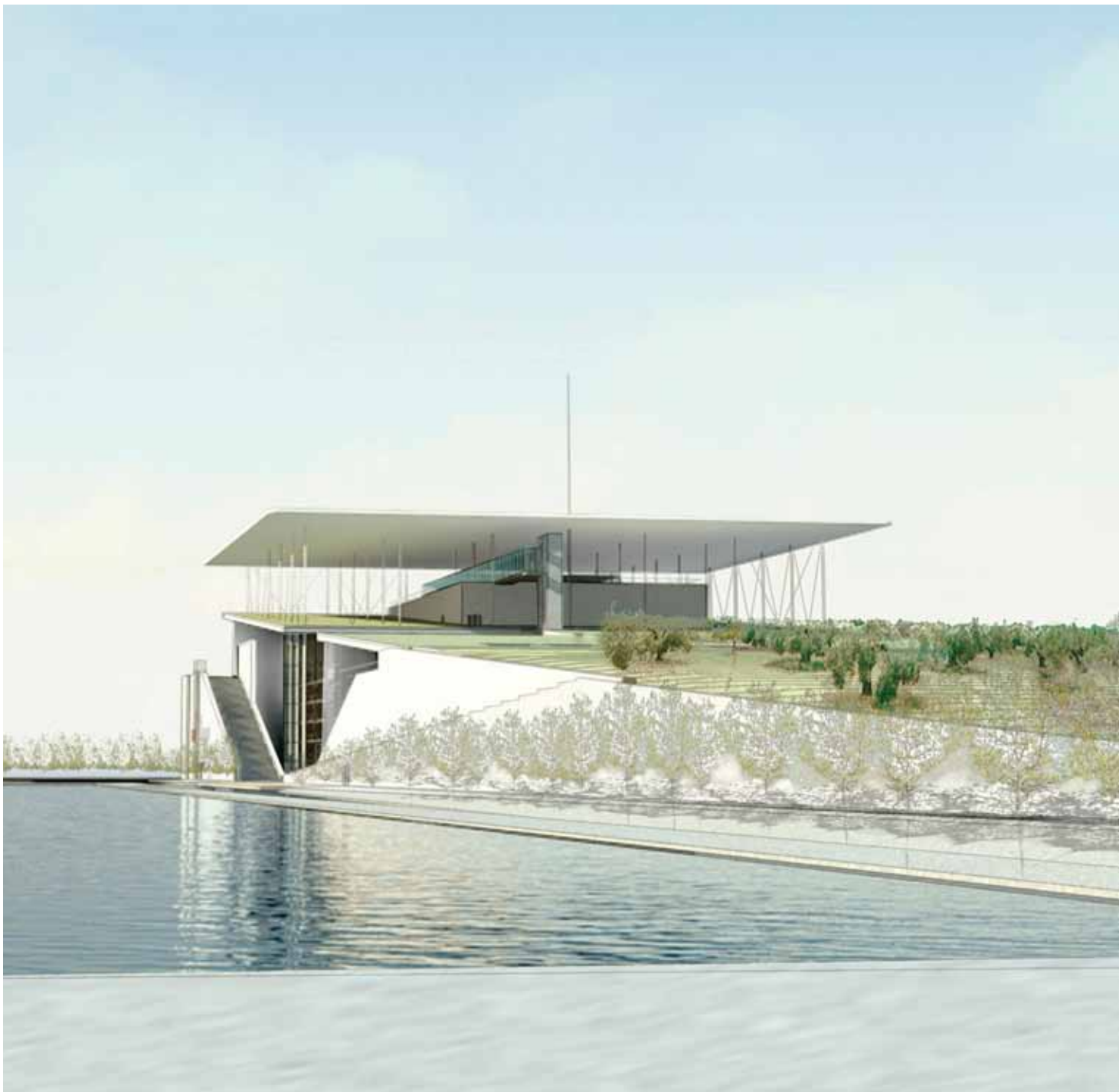
Rendering of the Library and Opera building in the Stavros Niarchos Cultural Center, future home of Spyros Louis's Breal cup.

Απόδοση του κπρίου της Βιβλιοθήκης και της Λυρικής στο Κέντρο Πολιτισμού Ίδρυμα Σταύρος Νιάρχος, το μελλοντικό σπίτι του Κυπέλλου Μπρεάλ του Σπύρου Λούη.