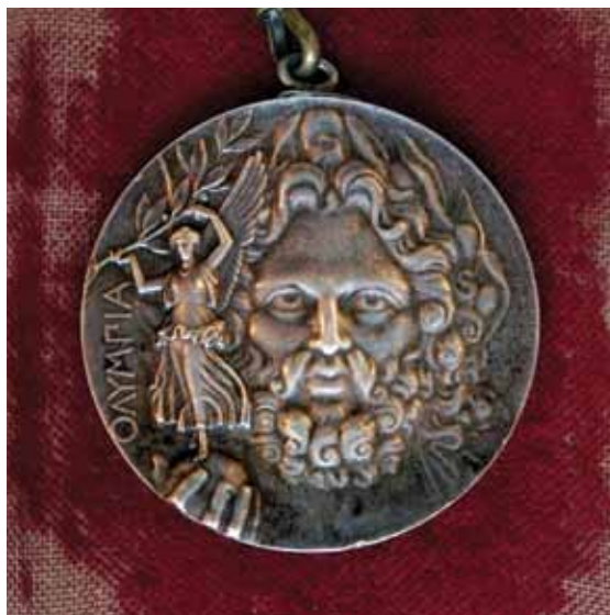
Spyros Louis' first place medal. Designed by the Frenchman Jules Clément-Chaplain. The front depicts the god Zeus holding Nike the goddess of victory. Το μετάλλιο πρώτης θέσης του Σπύρου Λούη. Σχεδιασμένο από τον Γάλλο Jules Clément-Chaplain. Η πρόσοψη απεικονίζει τον Δία κρατώντας τη Νίκη.

Αυτό ήταν το υπόβαθρο πάνω στο οποίο βασίστηκε η ιδέα του Μπρεάλ για τη δημιουργία ενός σύγχρονου Μαραθωνίου Δρόμου, που θα συμπεριλαμβανόταν στους πρώτους σύγχρονους Ολυμπιακούς. Ο Μπρεάλ πρότεινε την ιδέα του αγώνα και του κυπέλλου στο συνέδριο που πραγματοποιήθηκε στη Σορβόνη του Παρισιού το 1894, όπου ο Κουμπερτέν και οι στενοί του συνεργάτες, συμπεριλαμβανομένου του Έλληνα Δημήτριου Βικέλα, ανακοίνωσαν την αναβίωση των Ολυμπιακών Αγώνων και την πρώτη τους διοργάνωση στην Αθήνα, το 1896.