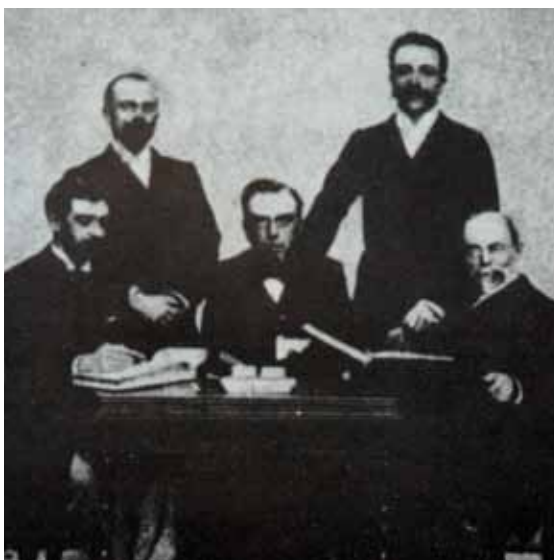
Members of the International Olympic Committee, Athens 1896. From left to right standing: Guth-Jarkovsky (Bohemia), Kemeny (Hungary), seated: Coubertin (France), Vikelas (Greece), Butovsky (Russia).

En συνέχεια, το 1879, ο Robert Browning, ένας από τους σημαντικότερους ποιητές της Αγγλίας του 19 ου αιώνα, ο οποίος γνώριζε, μεταξύ πολλών άλλων γλωσσών, και αρχαία ελληνικά, έγραψε το ποίημα «Φειδιππίδης», το οποίο περιλάμβανε στα ελληνικά τον υπότιτλο «χαίρετε νικώμεν», τη φράση που λέγεται ότι είπε ο Φειδιππίδης όταν ανακοίνωσε τη νίκη. Το ποίημα αναφέρει τη διαδρομή του Φειδιππίδη ως τη Σπάρτη προς αναζήτηση βοήθειας για τους Αθηναίους και αργότερα, στην προτελευταία στροφή του ποιήματος, τη διαδρομή του από τον Μαραθώνα στην Αθήνα: