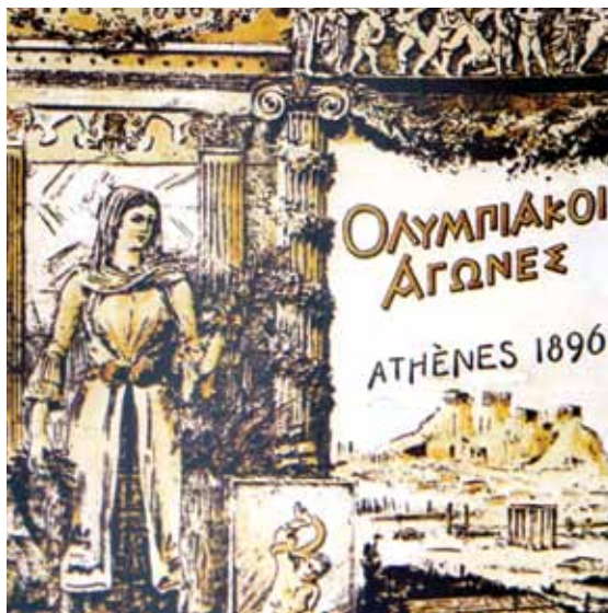
The cover of the official album of the Athens 1896 Olympics. Το εξώφυλλο του επίσημου λευκώματος των Ολυμπιακών Αγώνων της Αθήνας το 1896.

ως βραβείου για το νικητή, διότι συμβάδιζε με το όνειρο της αναβίωσης των Ολυμπιακών. Ο Μαραθώνιος Δρόμος ήταν μία πρωτότυπη ιδέα, ένα νέο άθλημα, το οποίο δεν υπήρχε ανάμεσα στους αγώνες που διοργανώνονταν στην Αρχαία Ολυμπία ή τους άλλους ιερούς χώρους όπου πραγματοποιούνταν αθλητικές εκδηλώσεις στην Αρχαία Ελλάδα. Ο μεγαλύτερος μήκος αγώνας δρόμου στην Ολυμπία ήταν ο «δόλιχος», (η απόσταση ήταν 24 «στάδια», τα οποία αντιστοιχούν σε 4,6 χιλιόμετρα ή 3 μίλια. Υπάρχουν, ωστόσο, άφθονα στοιχεία ότι οι Αρχαίοι Έλληνες έτρεχαν αποστάσεις πολύ