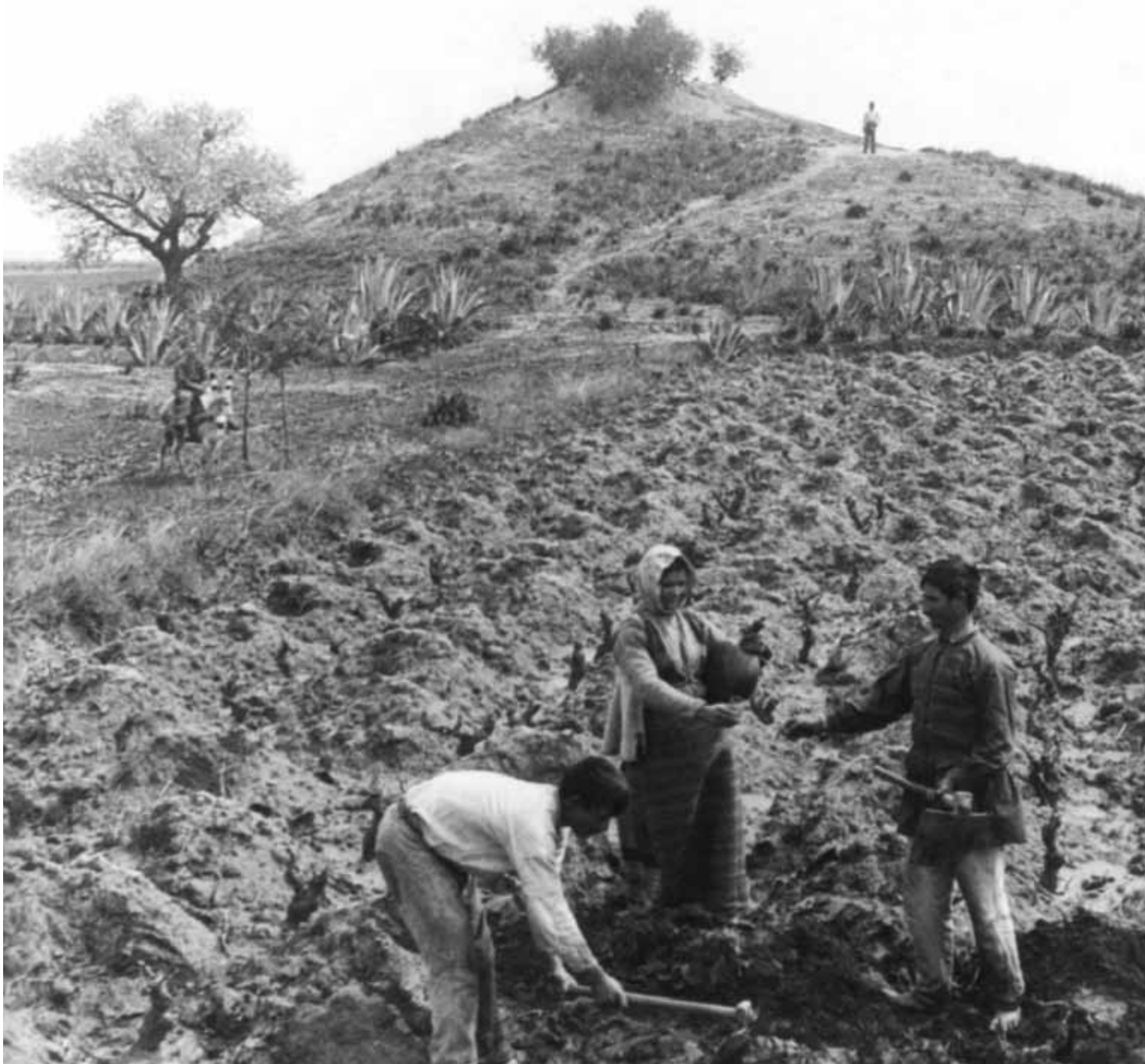
Tomb of Greeks who fell at the Battle of Marathon. Τύμβος των Ελλήνων που έπεσαν στη μάχη του Μαραθώνα.