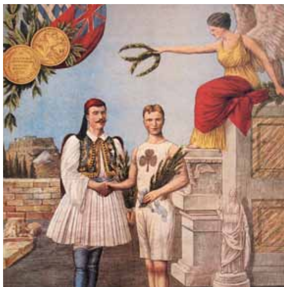
Artist's depiction of Louis with the Irish-Canadian William Sherring the, winner of the marathon race at the 1906 unofficial Olympics in Athens. Καλλιτεχνική απεικόνιση του Σπύρου Λούη με τον Ιρλανδο-Καναδό William Sherring, τον νικητή στους ανεπίσημους Ολυμπιακούς του 1906 στην Αθήνα.

Εκτός του ότι συνδέεται συνειρμικά με την αρχαία κληρονομιά των Ολυμπιακών Αγώνων, το Κύπελλο του Μπρεάλ είναι επίσης εμβληματικό του Μαραθωνίου Δρόμου των Ολυμπιακών της