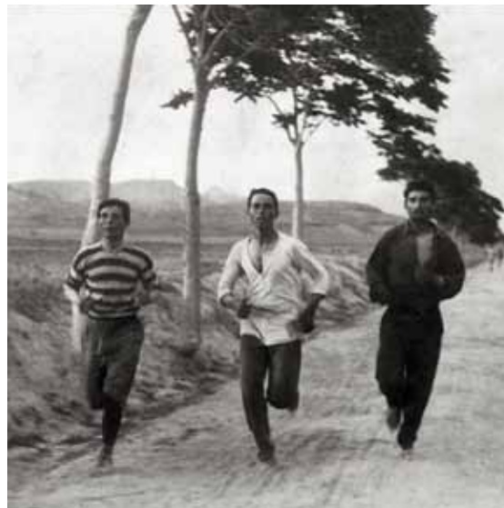
Athletes in training for the marathon at the 1896 Olympic Games in Athens. Αθλητές προπονούνται για τον μαραθώνιο στους Ολυμπιακούς Αγώνες του 1896 στην Αθήνα.

την ιδέα του αγώνα, φαντάστηκε ότι θα ξεκινούσε από τον Μαραθώνα και θα τελείωνε στην Πνύκα, τον λόφο στους πρόποδες της Ακρόπολης, όπου είχε συγκληθεί η συνέλευση των Αθηναίων και όπου ο αγγελιοφόρος έκανε την ανακοίνωσή του. Για πρακτικούς λόγους, ωστόσο, ο τερματισμός του Μαραθωνίου έπρεπε να γίνει στο Παναθηναϊκό Στάδιο, το οποίο φιλοξενούσε τους Ολυμπιακούς Αγώνες του 1896. Στην αλληλογραφία του με τον Δημήτριο Βικέλα, τον σύνδεσμο του Κουμπερτέν με τους διοργανωτές στην Αθήνα, ο Μπρεάλ εξέφρασε ρητά την ιστορική σημασία της ιδέας του.