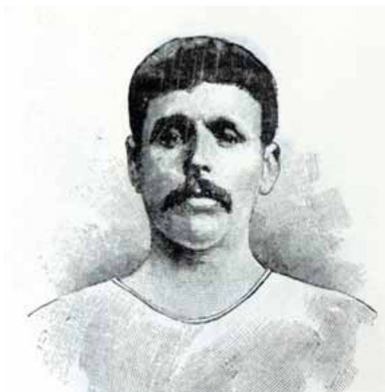
A portrait of Louis published in an Athens newspaper at the end of the 1896 Olympics. Πορτραίτο του Σπύρου Λούη δημοσιευμένο σε Αθηναϊκή εφημερίδα στο τέλος των Ολυμπιακών Αγώνων του 1896.

Η σύνδεση του παρόντος με την κλασική αρχαιότητα που αντιπροσώπευε η ιδέα του Μαραθωνίου ενισχύθηκε στην Αθήνα από τον Σπυρίδωνα Λάμπρου, Καθηγητή Ιστορίας του Πανεπιστημίου Αθηνών, ο οποίος συμμετείχε στην προαγωγή των Ολυμπιακών Αγώνων του 1896 και υπηρέτησε, αργότερα, ως γραμματέας της Ελληνικής Ολυμπιακής Επιτροπής, από το 1901 έως το 1917. Ο Λάμπρου υποστήριξε ότι ο Μπρεάλ είχε εμπνευστεί από την Ενάτη Ολυμπιακή Ωδή του Πινδάρου,