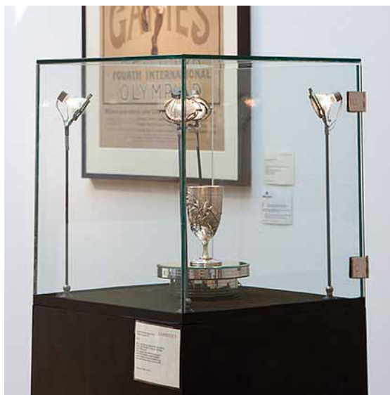
Bréal's Silver Cup at Christie's, April 18th, 2012 Το ασημένιο κύπελλο Μπρεάλ στον οίκο Christie's, 18 Απριλίου, 2012